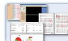
ODMS System, functional data analysis software.