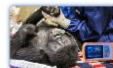
High sensitivity SpO 2 technology designed for animals specifically.